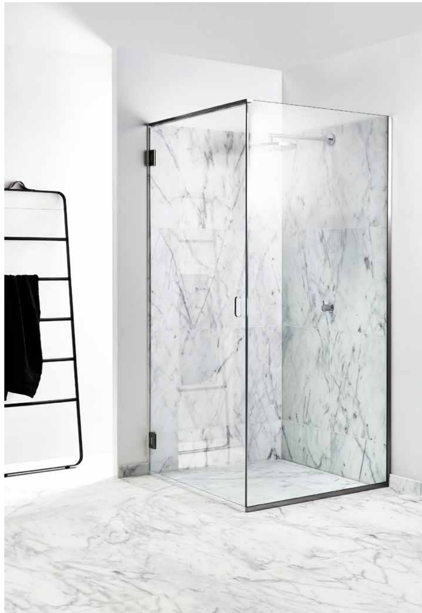
UNIDRAIN® GLASSLINE – KOMPLETTE DUSCHLÖSUNG MIT INTEGRIERTEM BODENABLAUF, HIGHLINE CUSTOM